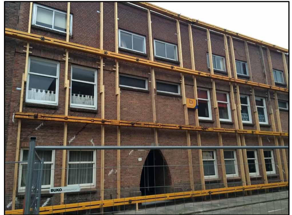
Ontruiming Margrietstraat: nooit meer

Buurtaanpak funderingsproblemen Kleiwegkwartier Site: www.goedgefundeerd.nl Mail: info@goedgefundeerd.nl